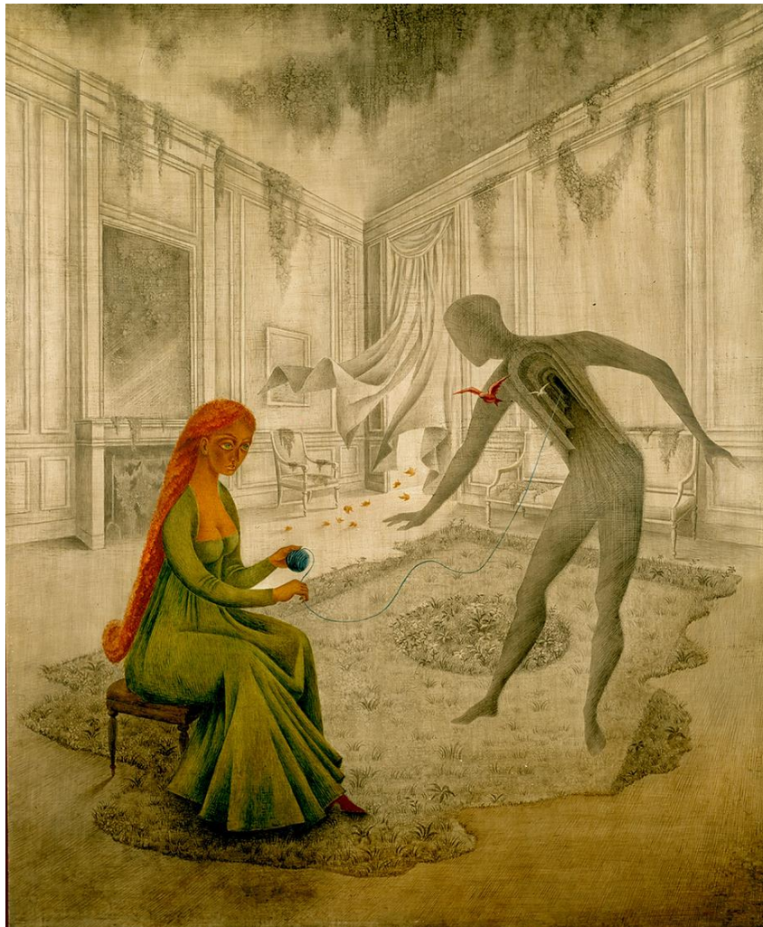
Remedios Varo. “Hojas muertas”. (1956)